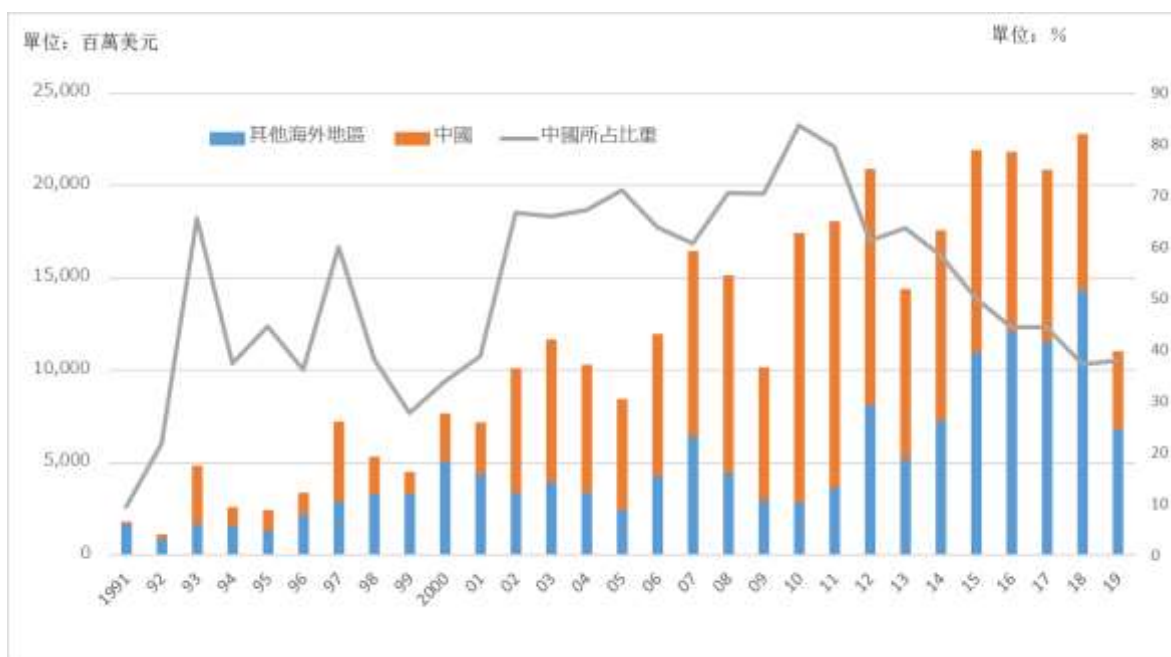
圖 2 中國在臺灣對外投資所占比重的變化