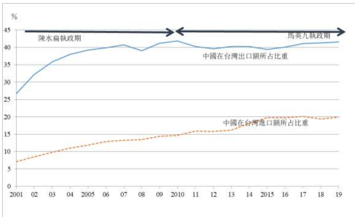
圖 1 中國在臺灣進出口額所占比重