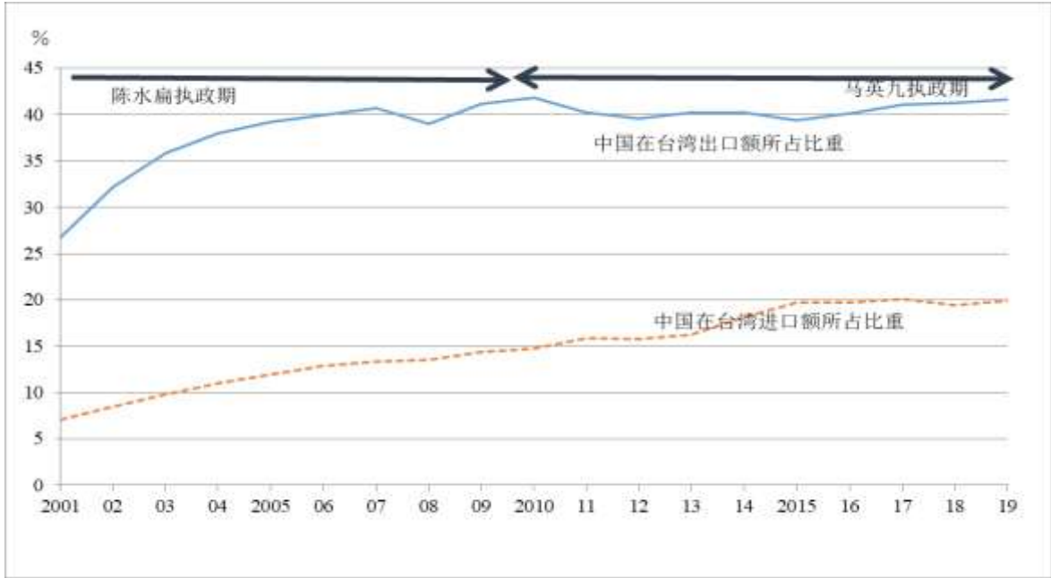
图 1 中国在台湾进出口额所占比重